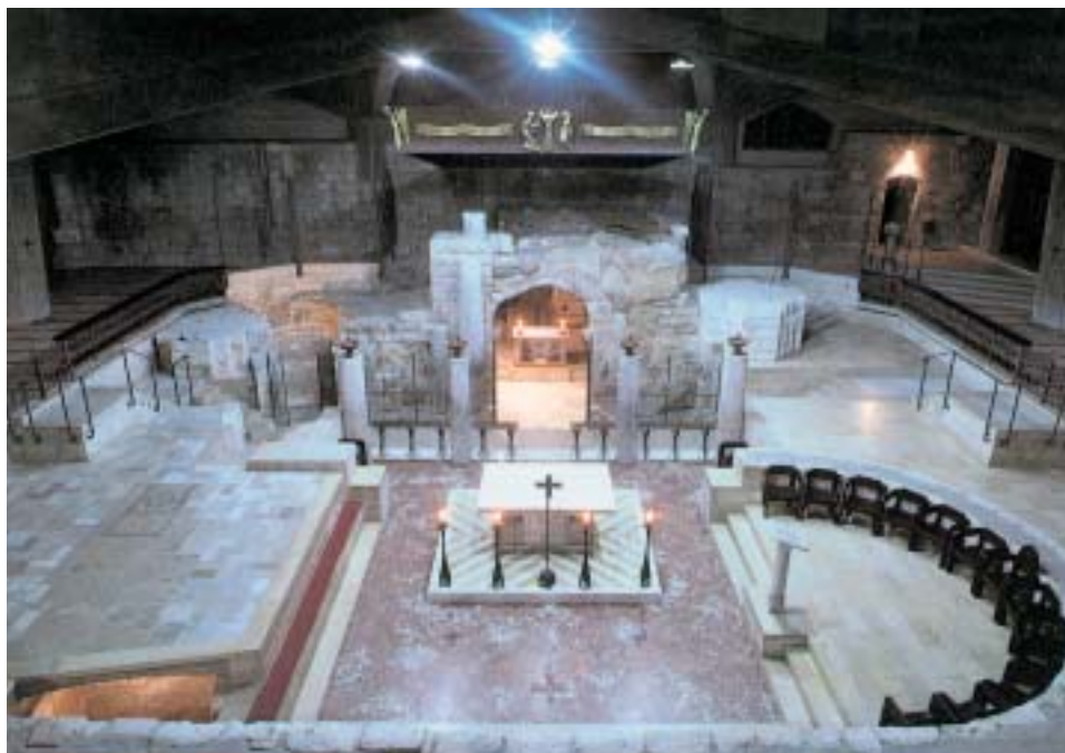
NAZARETH: CHIESA DELL'ANNUNCIAZIONE. INIZIO DELLA CHIESA CRISTIANA

Ora che stiamo pensando di fare una chiesa nuova e grande, ricordo che questo era anche il grandissimo desiderio di don Dario che, finito di costruire il centro scolastico e ricreativo di Olmo, diceva «Ora c'è da fare solo la chiesa!». Individuò nel terreno sopra le "sue" scuole il posto ideale per questa opera, proprio dove, se Dio vorrà, sorgerà presto il Centro parrocchiale di Santa Maria. Sono molto contenta che questo desiderio del nostro caro don Dario venga realizzato e anch'io non mancherò di contribuire secondo le mie modeste possibilità, specialmente dopo che avremo posto la prima pietra della nuova chiesa.» ■ (L.R.)