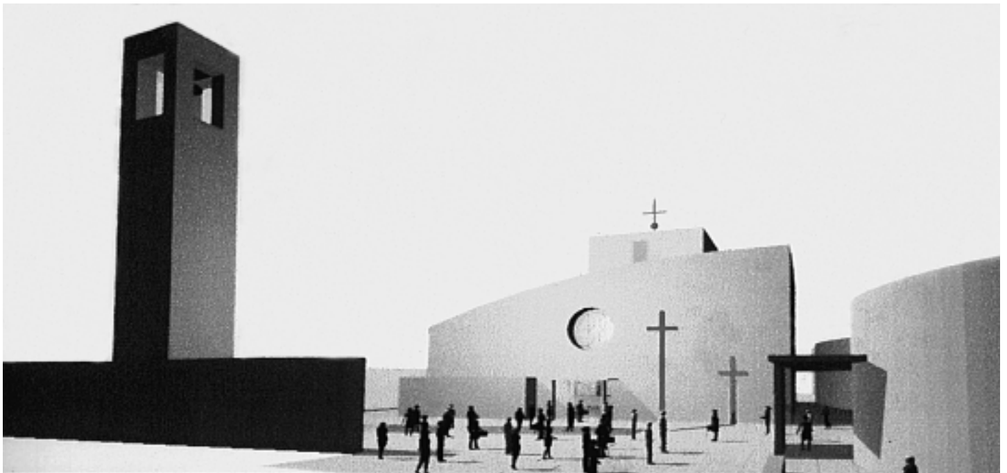
VISTA PROSPETTICA DEL COMPLESSO PARROCCHIALE

Presentato alla comunità il progetto per la realizzazione del centro parrocchiale