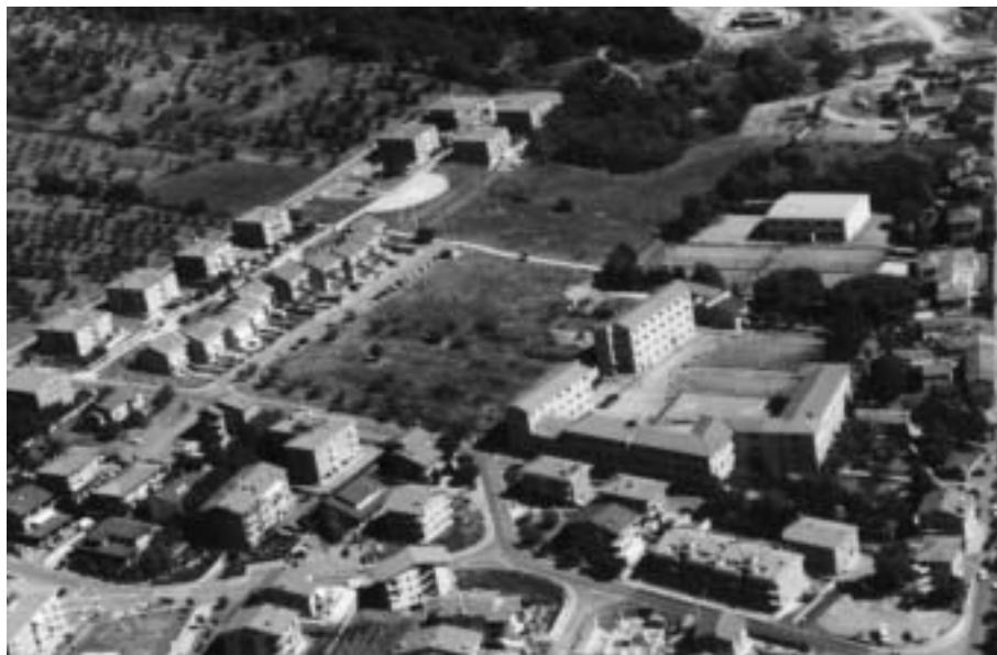
Il territorio per la nuova chiesa