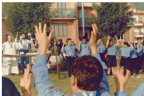
GLI SCOUT CORCIANO I, DA QUEST'ANNO UNITI AL GRUPPO PG 17 S. SISTO, CELEBRANO LA GIORNATA DEI "PASSAGGI" SUL TERRENO DOVE SORGERÀ LA NUOVA CHIESA DI S. MARIA DELLA SPERANZA. DA TRE ANNI QUESTO SPLENDDO SEGNO RAVVIVA LA NOSTRA DEVOZIONE A MARIA.