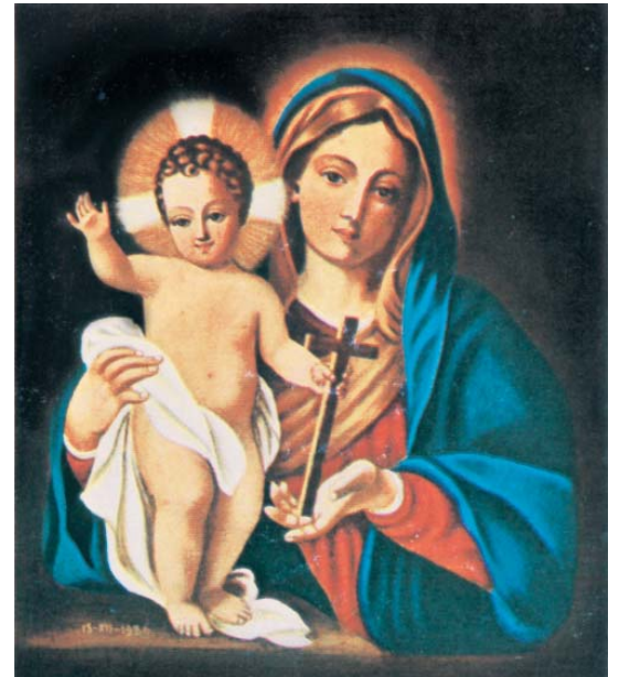
SANTA MARIA DELLA SPERANZA

Assegnato ufficialmente il nome al nuovo Centro Interparrocchiale