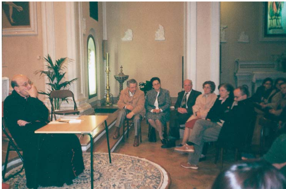
UN MOMENTO DELLA VISITA PARROCCHIALE DEL VESCOVO